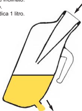
Svuotamento preciso, orientato grazie al collo del MTQUICK